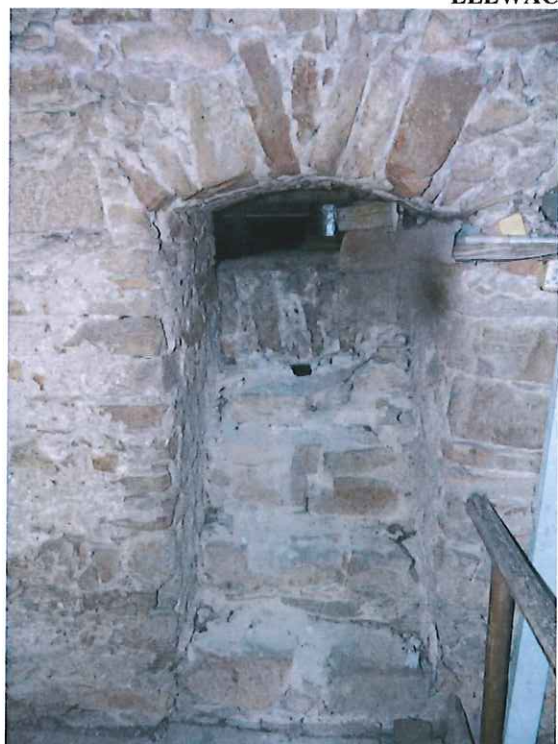
WEJŚCIE NA STRYCH