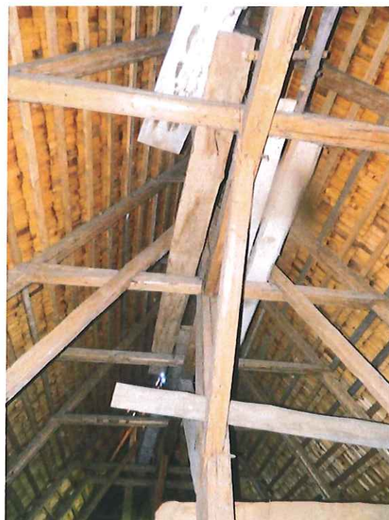
NAWA GŁÓWNA - WIEŻBA I GONT