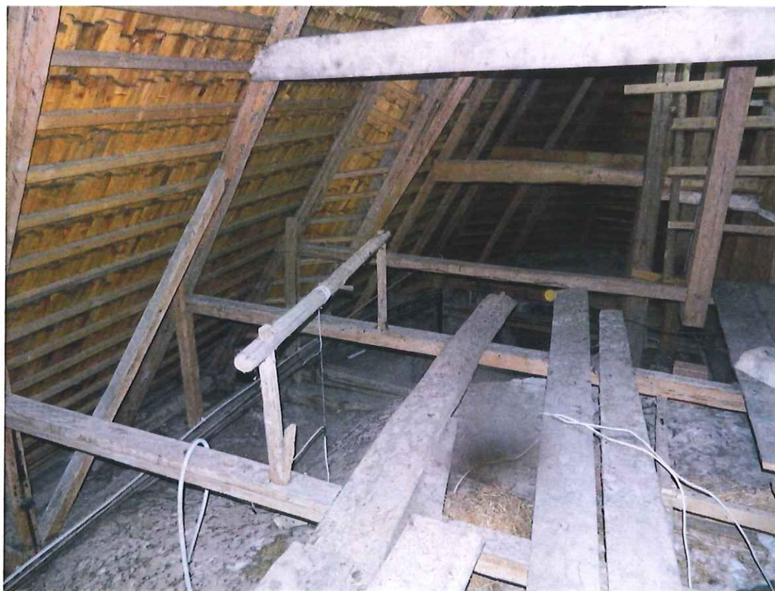
ZAKOŃCZENIE NAWY GŁÓWNEJ I DALEJ –PRZEBITERIUM (WIEŻBA I GONT) 11